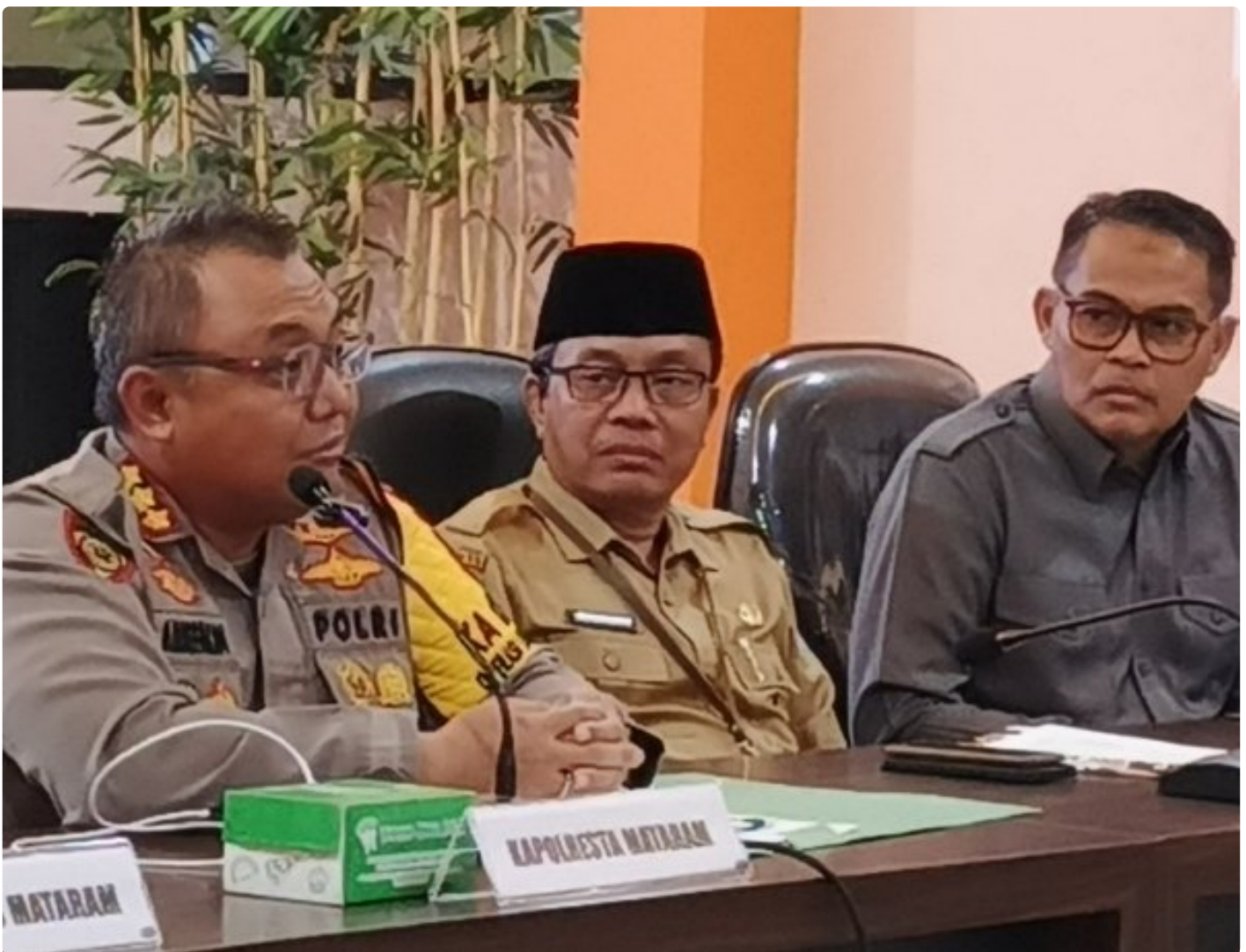
Kapolresta Mataram (Kiri) saat memimpin Konferensi pers akhir tahun, Selagi (31/12/2024)